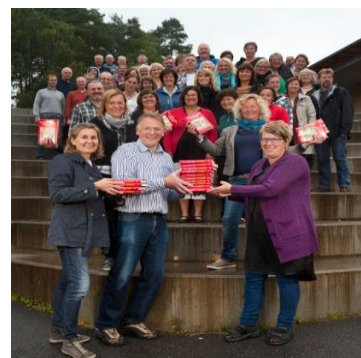
Oppstart Prøysen i KOR 2012