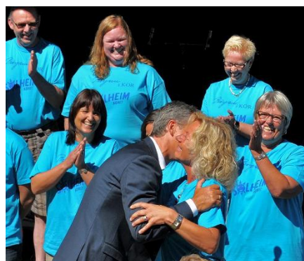
Jens Stolenberg lot seg sjarmere av Solheimkorets bidrag ved grunnsteinsnedleggelsen til det nye Prøysenhuset – juli 2013